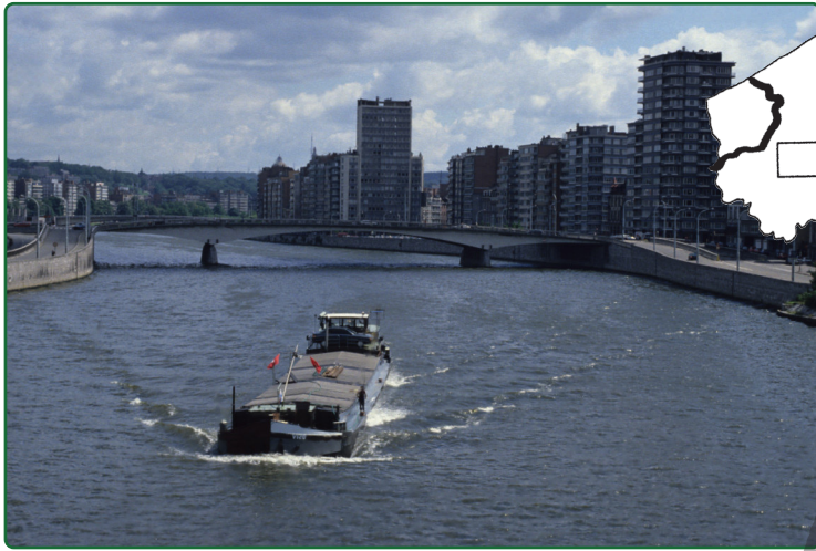
Les trois fleuves se jettent tous dans

Indique sur la carte le nom des trois fleuves de Belgique.